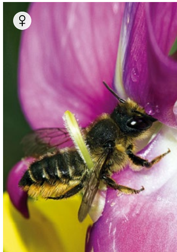
♀ GARTEN-BLATTSCHNEIDERBIENE Megachile willughbiella 13 – 14 mm · Mai – September

Die Garten-Blattschneiderbiene und ihre verwandten Arten kleiden ihre Brutzellen innen mit abgeschnittenen Blatteilen aus, die sie oftmals von Rosen gewinnen. Zur Brutanlage nutzt sie Gänge in Totholz. Die Männchen sind durch die verbreiterten und weißgelben Vorderbeine sehr auffällig.