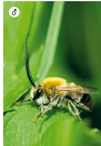
♂ MAI-LANGHORNBIENE Eucera nigrescens 10 – 12 mm · April – Juni

Die Schenkelbiene kann gut im Garten an Gilbweiderich beobachtet werden. Dort sammeln die Weibchen Pollen und Blütenöl. Das energiereiche Öl produziert die Pflanze anstelle von Nektar. Diese Nahrungsspezialisierung trifft man sehr selten unter den Wildbienen an. Als Nektarquelle dienen andere Pflanzenarten.