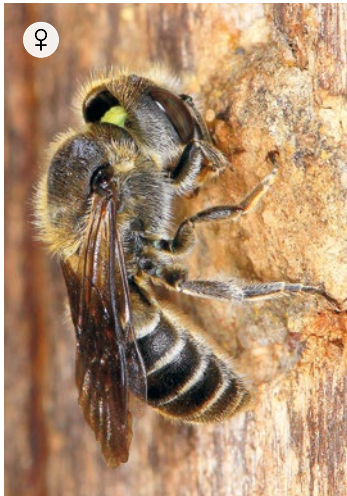
NATTERNKOPF-BIENE Hoplitis adunca 12 – 14 mm · Juni – August

Die Wollbiene nistet in oberirdischen Hohlräumen, die mit Pflanzenfasern ausgekleidet werden. Die Männchen betreiben dabei ein sehr auffälliges Revierverhalten. Sie bewachen ihre Futterpflanzen aus der Luft und lassen nur Weibchen der eigenen Art zu. Andere Blütenbesucher, auch Honigbienen, werden attackiert und vertrieben.