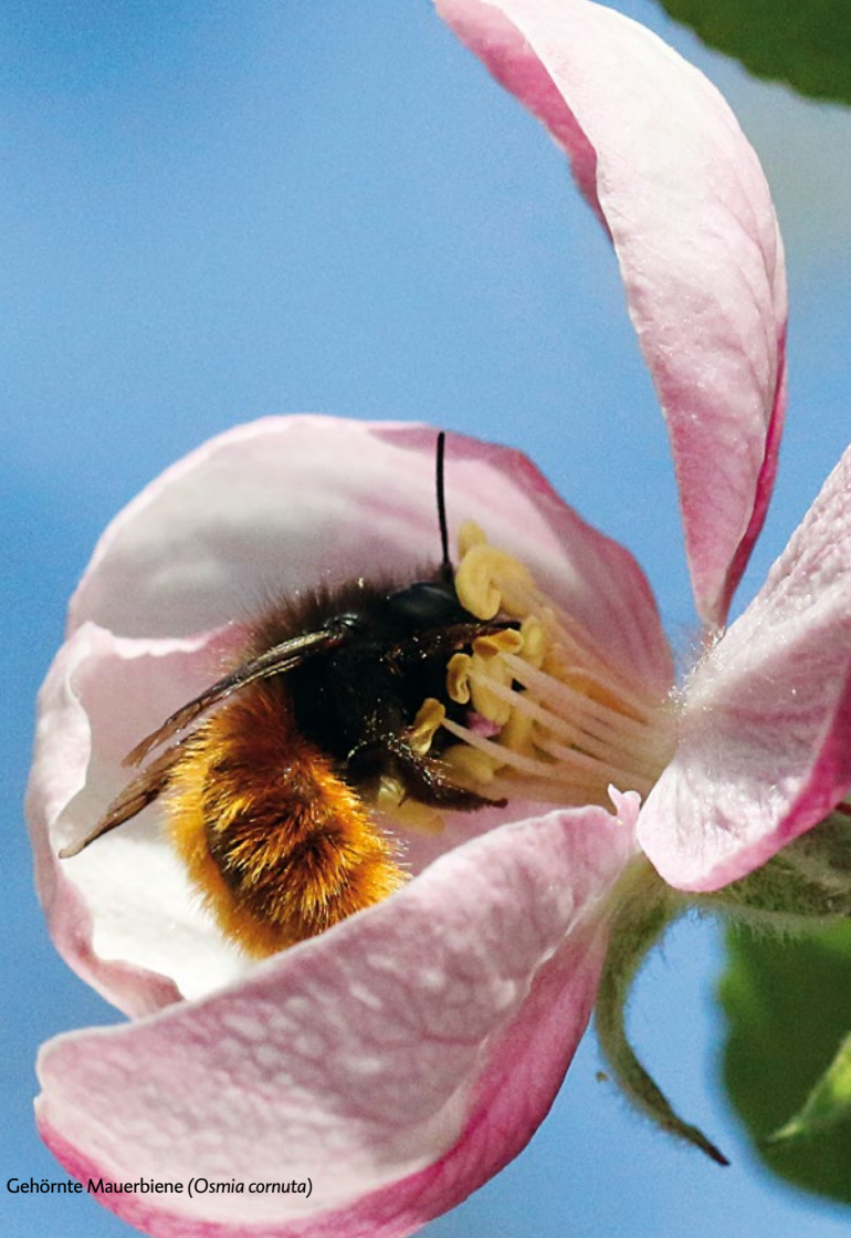
Gehörnte Mauerbiene ( Osmia cornuta )