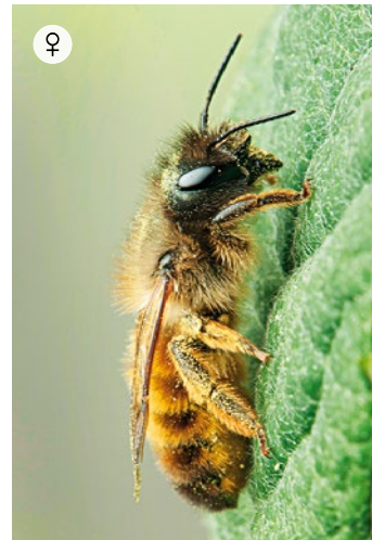
ROTE MAUERBIENE Osmia bicornis 12 – 14 mm · April – Mai

Die Natterkopf-Biene ist eine hoch spezialisierte Art, die zur Pollenaufnahme ausschließlich Natterkopf nutzen kann. Wo die blau blühende Trockenpflanze wächst, wird sie schnell heimisch. Sie kann im Garten leicht angesiedelt werden, sofern dort Natterkopf angepflanzt wird. Sie nistet gern in Insektenhotels.