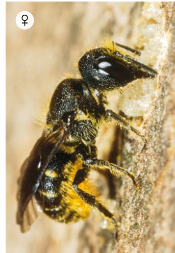
GEWÖHNLICHE LÖCHERBIENE Heriades truncorum 6 – 8 mm · Juni – August

Die Rote Mauerbiene ist im Frühjahr eine der häufigsten Wildbienenarten in unseren Gärten. Die Männchen sind leicht an den langen Fühlern zu erkennen, die Weibchen an den Hörnern auf der Stirn. Die Art nistet in Totholz, Mauerspalt und anderen Hohlräumen. Manchmal tritt sie dabei in großer Anzahl auf.