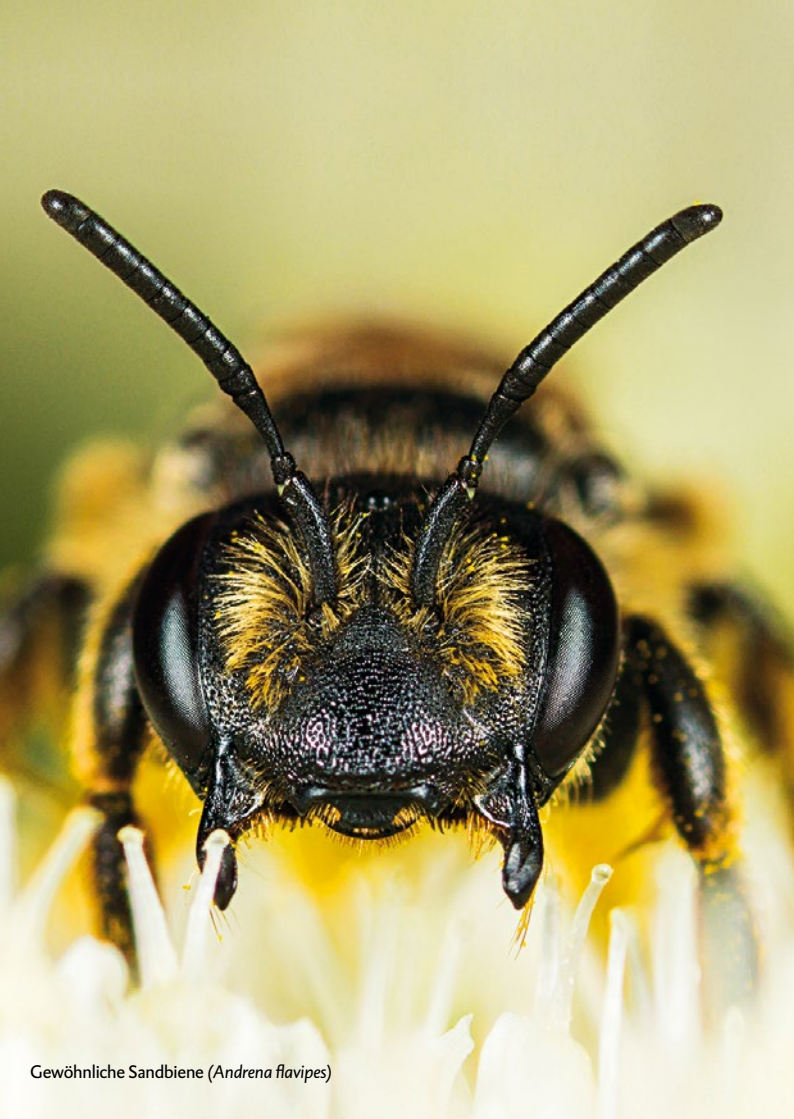
Gewöhnliche Sandbiene ( Andrena flavipes )