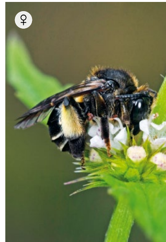
♀ AUEN-SCHENKELBIENE Macropis europaea 7 – 8 mm · Juni – August

Die Frühlings-Pelzbiene ist eine der ersten Wildbienen in Garten oder an Waldrändern. Sie ist leicht an ihrer pelzigen Gestalt zu erkennen – die Männchen zudem an ihrem gelben Gesicht. Die Arten nisten in selbst gegrabenen Erdgängen, die oft an Steilwänden oder Böschungen angelegt werden.