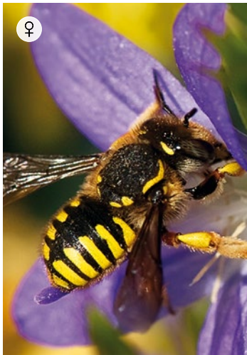
GARTEN-WOLLBIENE Anthidium manicatum 13 – 15 mm · Mai – Juli

Die Wollbiene nistet in oberirdischen Hohlräumen, die mit Pflanzenfasern ausgekleidet werden. Die Männchen betreiben dabei ein sehr auffälliges Revierverhalten. Sie bewachen ihre Futterpflanzen aus der Luft und lassen nur Weibchen der eigenen Art zu. Andere Blütenbesucher, auch Honigbienen, werden attackiert und vertrieben.