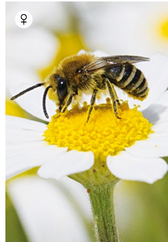
♀ RAINFARN-SEIDENBIENE Colletes similis 9 – 11 mm · Juni – August

Die Trauerbiene ist ein Brutparasit bei der Frühlings-Pelzbiene. Beide Arten sind vor allem an Steilwänden oder offenen Böschungen zu finden, wo die Pelzbiene ihre Nester gräbt. Die Trauerbienen fliegen dort langsam auf und ab und warten auf eine günstige Gelegenheit, um in das Wirtsnest eindringen zu können.