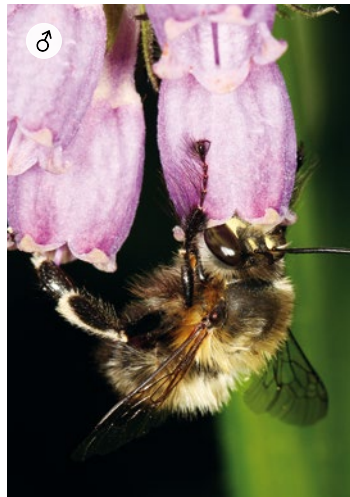
♂ FRÜHLINGS-PELZBIENE Anthophora plumipes 13 – 14 mm · März – Mai

Die Garten-Blattschneiderbiene und ihre verwandten Arten kleiden ihre Brutzellen innen mit abgeschnittenen Blatteilen aus, die sie oftmals von Rosen gewinnen. Zur Brutanlage nutzt sie Gänge in Totholz. Die Männchen sind durch die verbreiterten und weißgelben Vorderbeine sehr auffällig.