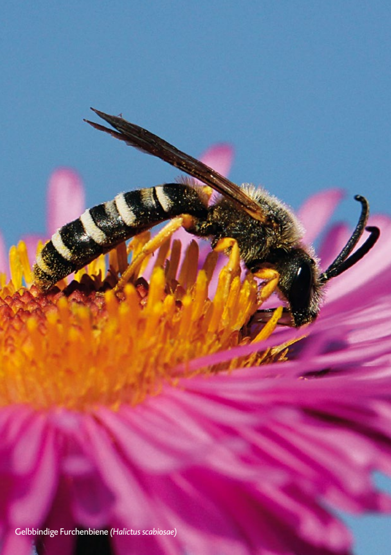
Gelbbändige Furchenbiene ( Halictus scabiosae )