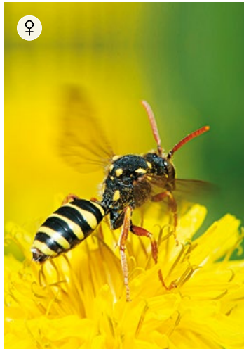
♀ GEBÄNDERTE WESPENBIENE Nomada succincta 10 – 12 mm · April – Mai

Die Große Blutbiene ist eine parasitische Bienenart, die sandige Böden benötigt und dort leicht beim Suchflug nach Wirtsnestern beobachtet werden kann. Es gibt in Deutschland weitere 24 Blutbienen-Arten, die alle eine rot-schwarze Färbung aufweisen.