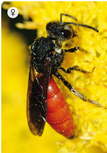
♀ GROSSE BLUTBIENE Sphcodes albilabris 10 – 12 mm · April – August

Die Große Blutbiene ist eine parasitische Bienenart, die sandige Böden benötigt und dort leicht beim Suchflug nach Wirtsnestern beobachtet werden kann. Es gibt in Deutschland weitere 24 Blutbienen-Arten, die alle eine rot-schwarze Färbung aufweisen.